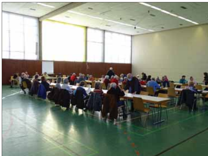
Einige Teilnehmer der Jahreshauptversammlung

Bericht erstellt am 21.11.2021 Klaus Birmelin, Öffentlichkeitsarbeit