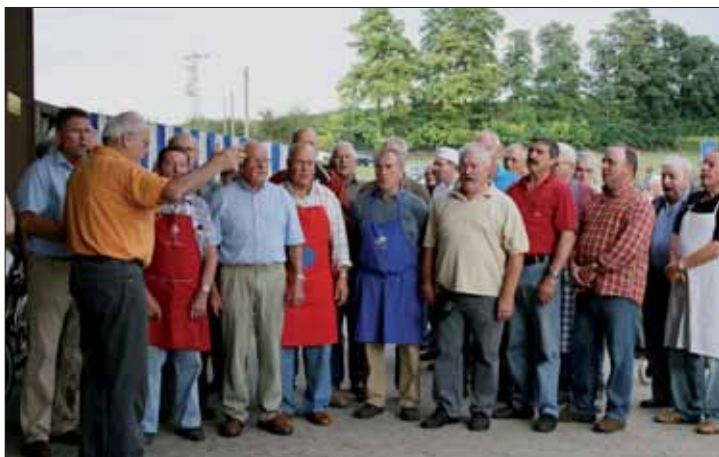
Die Sänger begrüßen die Gäste.

Wir freuen uns, Sie nächstes Jahr wieder begrüßen zu können.